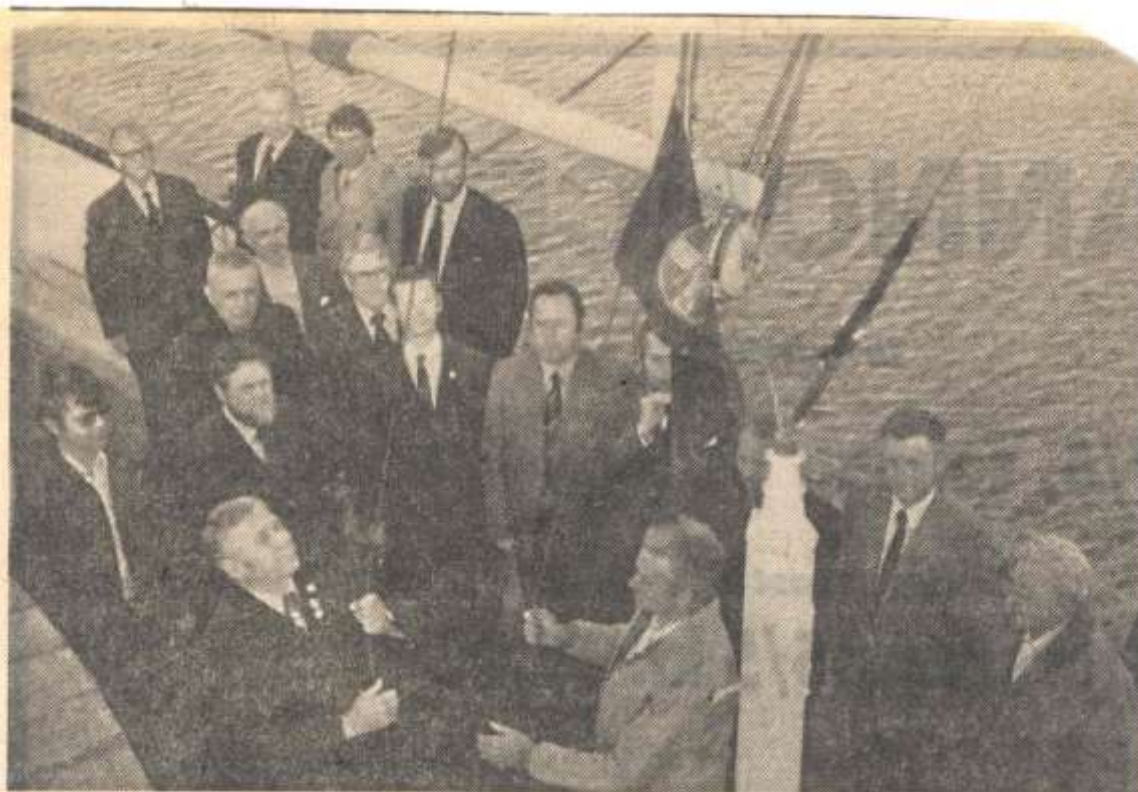
STANDERHEJSNING: SA vajer Marineforeningens stander over fyrskibet i Haderslev Havn. Haderslev Marineforening, der blev genoplivet for kort tid siden, kunne med en væsentlig del af medlemsskaren gennemføre den højtidelige standerhejsning, og hermed markere, at man er startet, ikke alene på en ny sæson, men igen.