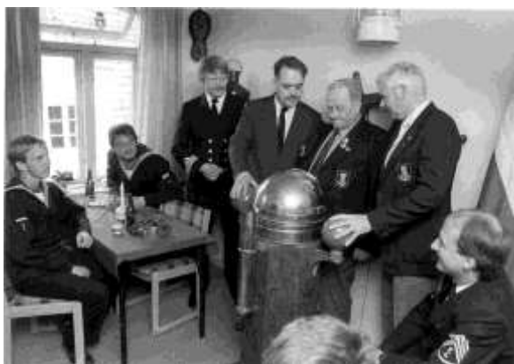
Receptionsgæster i marinestuen.