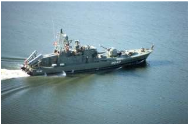
HAMMER på "fladt hav" samt på vej til Haderslev.

I 1950 adopterede byen torpedobåden HAMMER og afdelingen var også her, som ved adoptionen af den næste HAMMER i 1978 stærkt involveret i adoptionshandlingen og de dertil knyttede arrangementer.